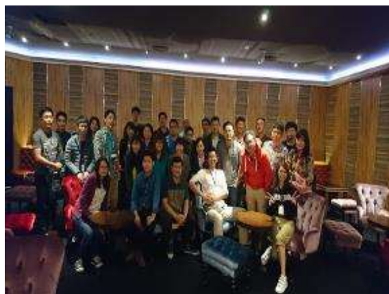
員工電影日-GOLD CLASS 頂級影廳