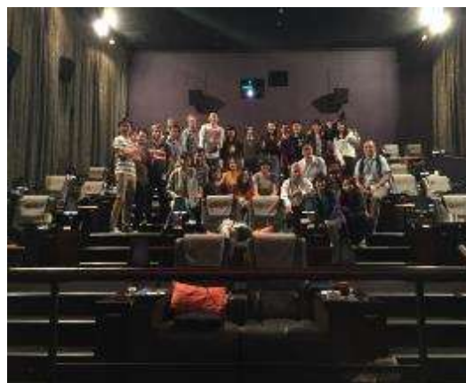
員工電影日-包場看電影