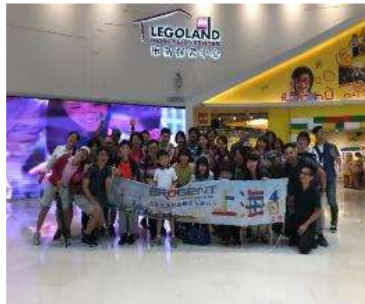
員工旅遊-上海樂高樂園參訪