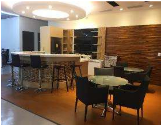
員工交流區-每日供應免費咖啡及零食